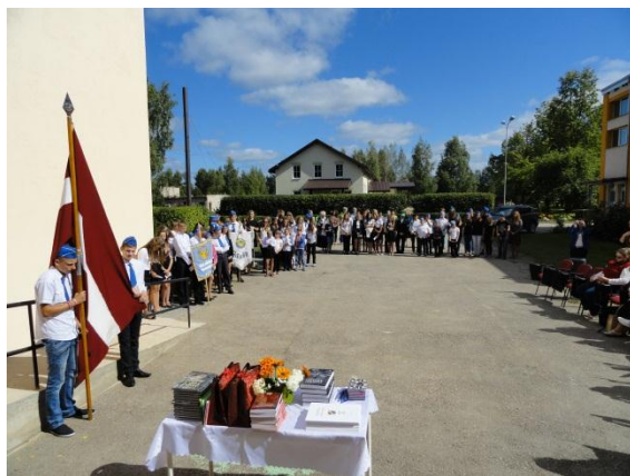
Vanadzēnu ierašanās un pulcēšanās.