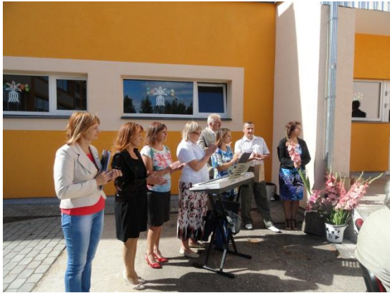
Eglaines pamatskolas un pašvaldības vadība.