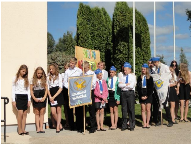
Eglaines pamatskolas Vanadzēnu grupa ar savu karogu.