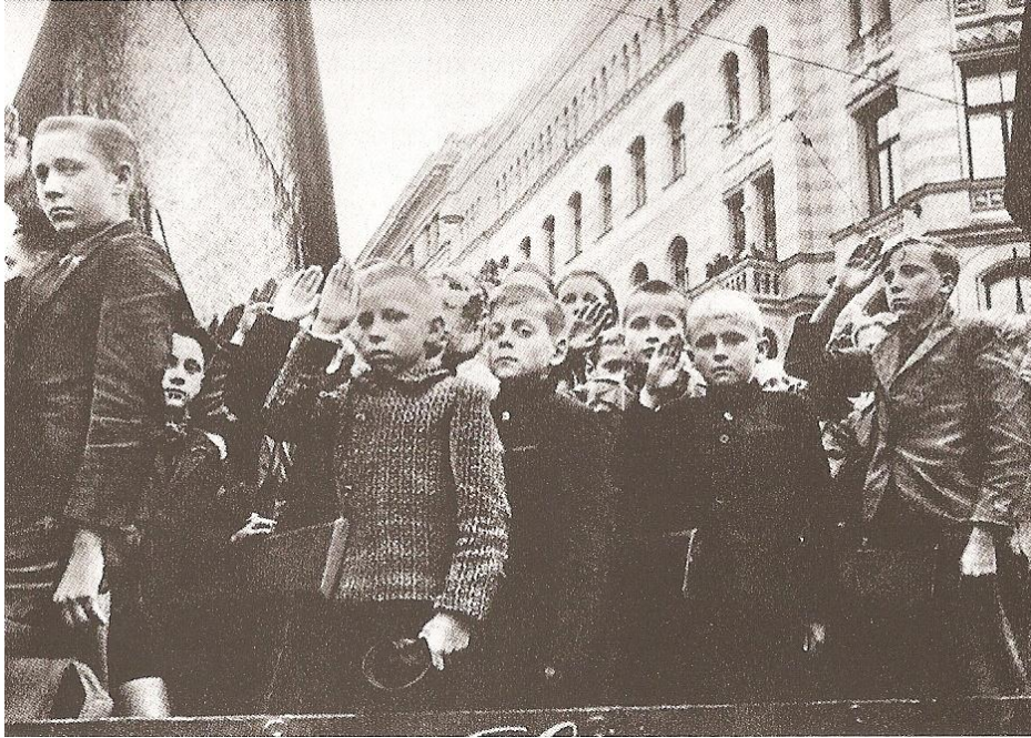
Latviešu bērni Rīgā spiesti piedalīties propagandas gājienos (1940.-1941. g.)

Atskatīsimies uz Otrā pasaules karu un ko puda nacistiskā Vācija un totalitārā Padomju Savienība par Latviešu leģionu. Vācieši visumā nevarēja noformēt Latviešu leģionu, bet paveica to ar maldinājumiem, lai uz ārpusi radītu iespaidu, ka viņi (vācieši) pieturas pie internacionālajām konvencijām un ka leģionāri ir brīvprātīgie ; bet iekšēji, pārkāpjot visas starptautiskās normas, un ar brutālu varu, lai nodibinātu Latviešu leģionu, bāzējoties uz tiešu Hitlera pavēli, notika iesaukšana (mobilizācija, jo reti kāds pieteicās brīvprātīgi). Pēc Otrā pasaules kara, KKK bija ļoti svarīgi nostādīt Latviešu leģionārus noziedznieku statusā, jo KKK apzinājās, ka lielākā tautas daļa neuzskatīja viņus par SS noziedzniekiem. Lai būtu SS, pirmkārt bija jābūt vācietim. Latvijā (arī Igaunijā un Lietuvā) tūlīt tika iedarbināta KKK lielā propagandas melu mašīna (tieši sekojot Ļeņina mācībai), un visi PSRS gūstā nonākušie latviešu karavīri, tai skaitā arī leģionāri, nokļuva PSRS vergu nometnēs vai arī tika apšauti. Rietumu sabiedrotie, toties pretēji KKK rīcībai, jau tūlīt pēc kara atzina, ka Latviešu leģions nav SS formējums, bet gan vienkāršs mobilizēts karavīru formējums.