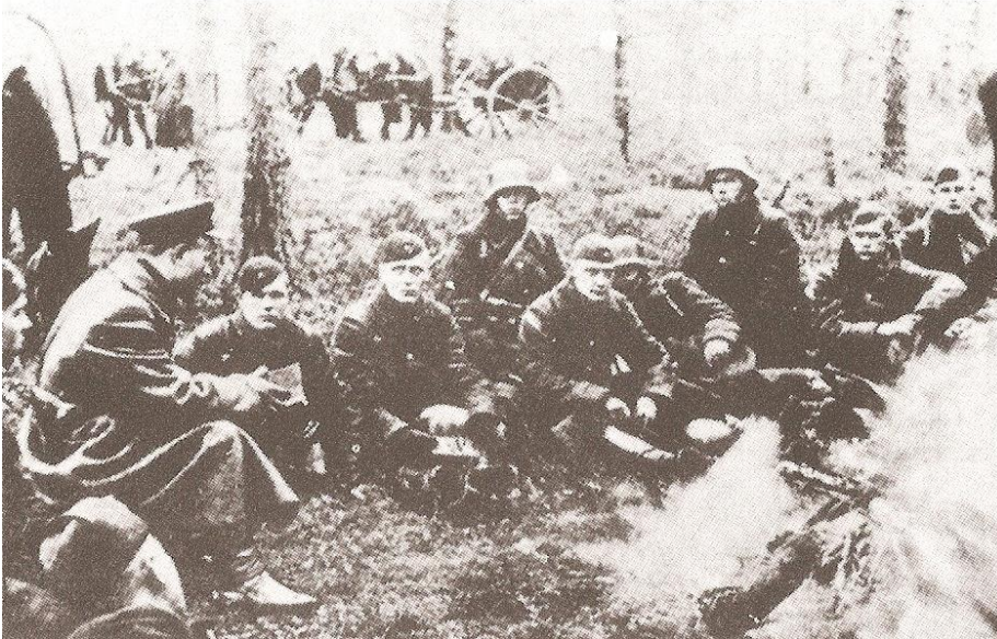
1940.-1941. gadā: Krievu politiskais virsnieks ”skolo” Latvijas jauniesauktos karavīrus.

ieguldīja tik milzīgus resursus, pat gigantiskā apmērā, savas tautas un ienaidnieku maldināšanā, lai sasniegtu savus mērķus. Abu diktatoru politiskie un fiziskās varas sasniegumi lielā mērā balstījās uz psiholoģiskiem ietekmes pamatiem – meliem un nepārtrauktu tautas maldināšanu. Tā ir kara darbība, kurā ienaidnieks izplata dezinformāciju, sagroza patiesību, vai vispār nesniedz informāciju, kas varētu būt kaitīga pašam sev. Slavenais ķīniešu kara mākslas autors, Sun Tzu, pāris tūkstošus gadus atpakaļ teica – ”Nav vajadzīgs iznīcināt savu ienaidnieku. Pietiek tikai iznīcināt viņa gribu piedalīties kaujā”.